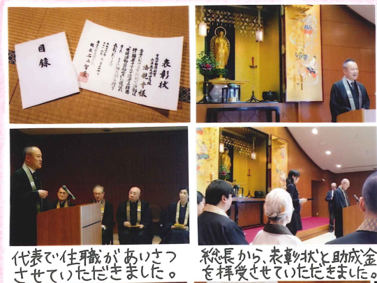
代表で住職が挨拶させていただきました。 総長から表彰状と助成金を授けられました。

「法親寺新聞」が、西本願寺の「実践活動奨励賞」を受賞!! 西本願寺での表彰式に住職と紗音が出席してきました。7年以上続けていて、他の寺院に比べて年間発行数が多いこと、それが全て手書きであることに驚き、称賛してくださいました。続けてきて良かった!! いつも励ましてくださる門徒の皆様のお陰です...。詳しくは、ホームページをご覧ください♡