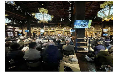
報恩講法要の様子

現地にお越しのご門徒とお勤めをした後、大谷本廟無量壽堂にある法親寺納骨堂に納骨させていただきました。本山の御正忌報恩講へも、お参りいたしました。